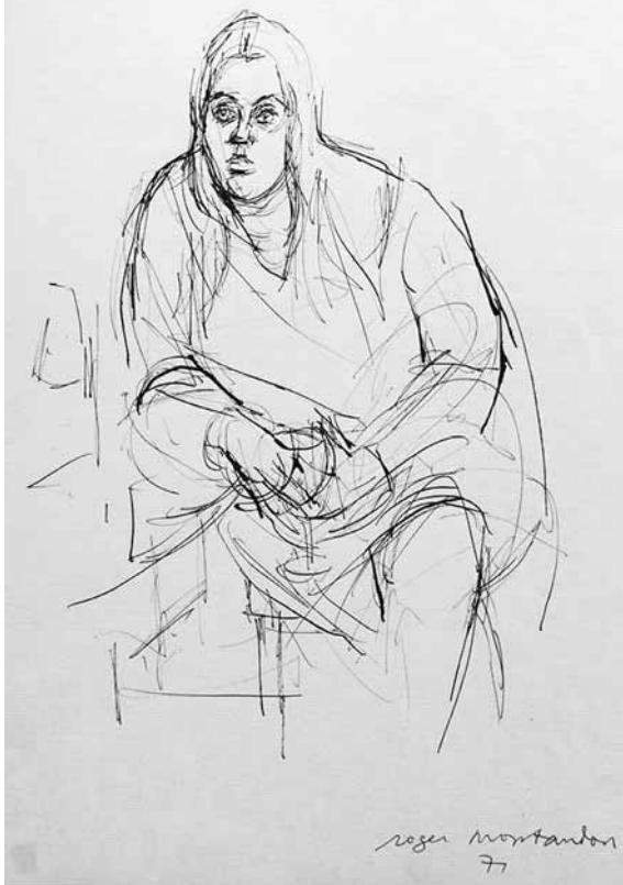
Zouc par Roger Montandon, dessin à l'encre de Chine, 1971.